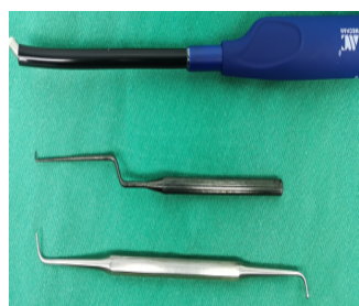
图1 手术用低温等离子刀和显微直角钩针