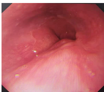
图2 术后3个月复查胃镜